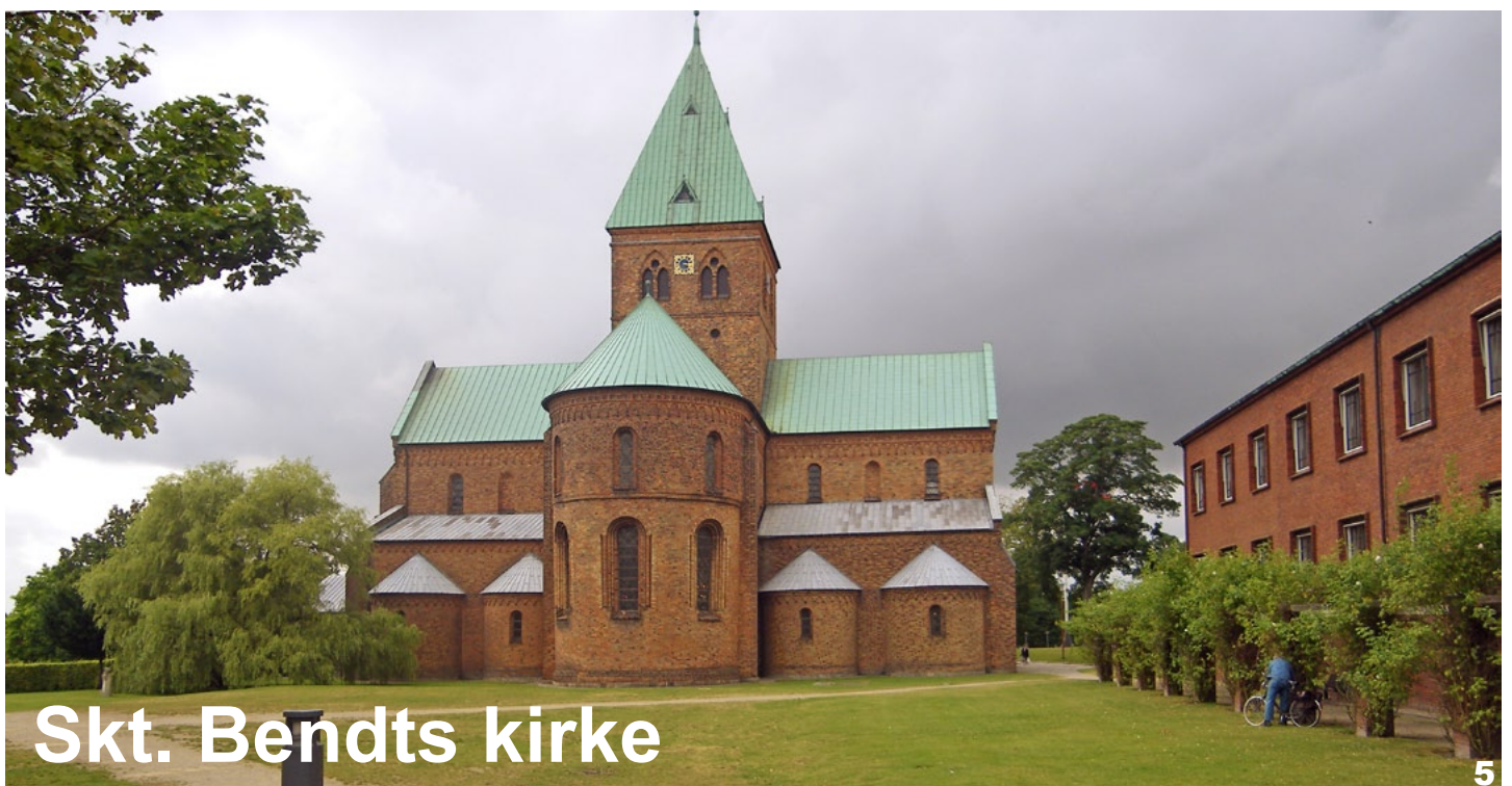
Skt. Bendts kirke

I Haraldsted by drejes af skråt til venstre ad mindre sti ved udkanten af byen (v. husgavl m. årstallet 1933). Følg stien ca. 500 meter og drej venstre ned ad stejl skråning til Haraldsted sø. Følg stien til højre over dæmningen og forbi sejlklubben, efter ca. 100 meter drej til højre ad sti. Følg stien, gå over landevejen til ny sti og følg denne igennem Torpet mose til Havemøllevej. Fortsæt lige ud ad ruten mod Sorø eller drej til venstre imod Ringsted vandrehjem (ved Skt. Bendts Kirke, som kan ses fra stien).