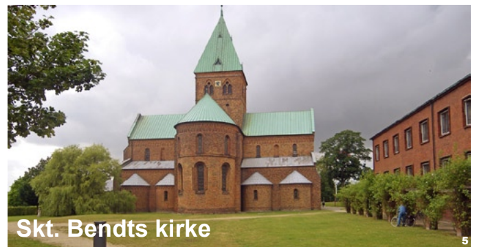
Skt. Bendts kirke

I Haraldsted by drejes af skråt til venstre ad mindre sti ved udkanten af byen (v. husgavl m. årstallet 1933). Følg stien ca. 500 meter og drej venstre ned ad stejl skråning til Haraldsted sø. Følg stien til højre over dæmningen og forbi sejlkлубben, efter ca. 100 meter drej til højre ad sti. Følg stien, gå over landevejen til ny sti og følg denne igennem Torpet mose til Havemøllevej. Fortsæt lige ud ad ruten mod Sorø eller drej til venstre imod Ringsted vandrehjem (ved Skt. Bendts Kirke, som kan ses fra stien).